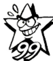
csOA Officina 99 www.officina99.org